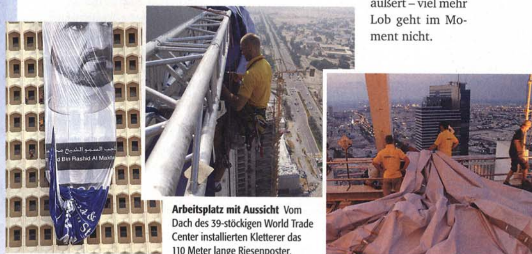
Arbeitsplatz mit Aussicht Vom Dach des 39-stöckigen World Trade Center installierten Kletterer das 110 Meter lange Riesenposter.